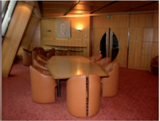
Salle de réunion