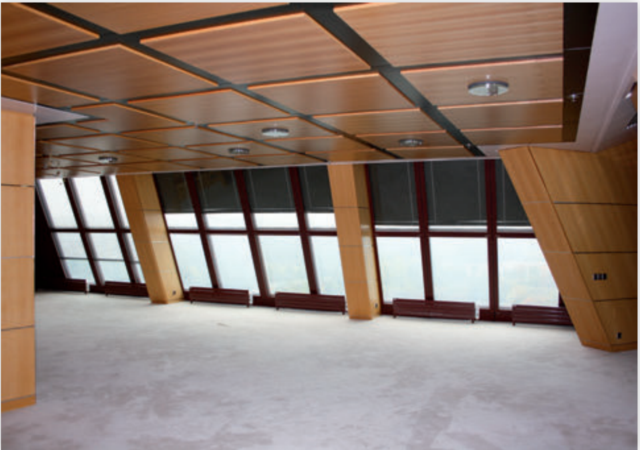
Bureau « open space »